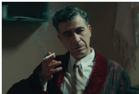
Don Luciano ( Lucky Luciano)